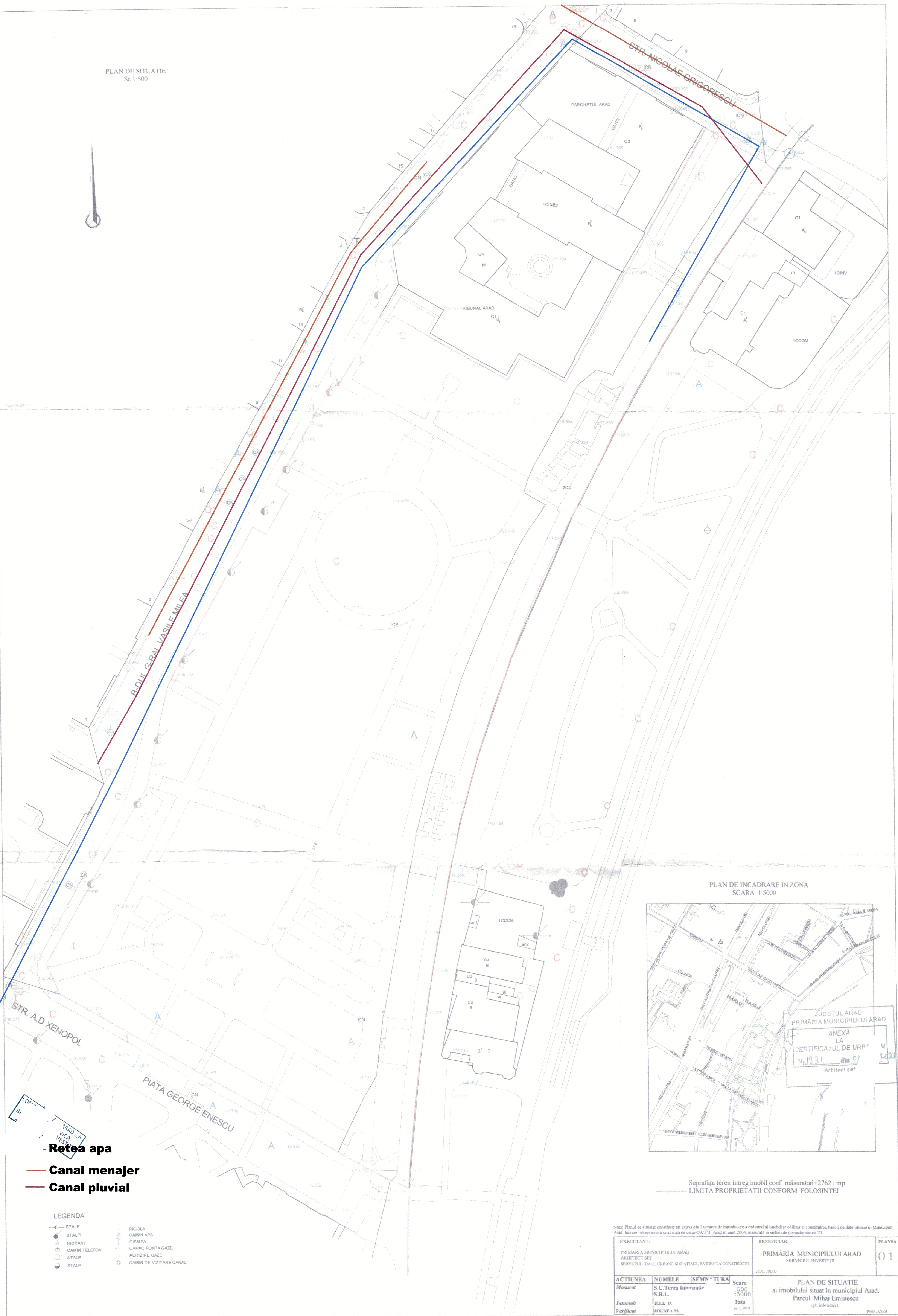
PLAN DE INCADRARE IN ZONA SCARA 1:5000